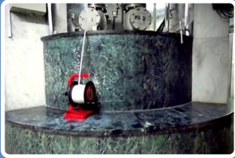
ஸம் ஸம் கீணறு